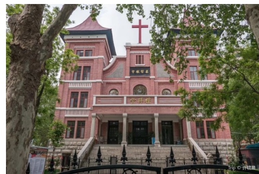
Iglesia gubernamental China

Las creencias doctrinales de ambos tipos de iglesias varían ampliamente entre sí. Dependerá de la iglesia y del pastor individuales en cuanto a si se enseña la verdad bíblica, y se predica el Evangelio. Ir a una iglesia de la casa no garantiza que la Biblia se enseñará correctamente ni va a una iglesia gubernamental garantiza que la Biblia se enseñará incorrectamente. Eso dependerá de la iglesia local individual. Sin embargo, hay algunas declaraciones generales de fe que siguen los dos tipos diferentes de iglesias que revelan las diferencias entre las creencias de las dos. Al leerlas es evidente que las creencias de la iglesia de la casa están mucho más en línea con la Biblia que las iglesias gubernamentales. Hay algunas preocupaciones serias con las creencias de la iglesia del gobierno. Parecen mezclar obras con gracia, y no enseñan claramente que la salvación es sólo por gracia a través de la fe. Permiten el bautismo aspersion. El fundamento de su fe no se basa solo en la Biblia, sino también en los apóstoles' y credos nicenos. También hay otras cosas que están fuera de línea con la Biblia, pero estas son tres de las cosas principales. Esto no significa que cada iglesia gubernamental cree en estas cosas, ni tampoco que cada iglesia casa está alineada con las enseñanzas de la Biblia.