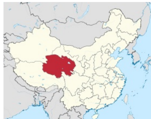
Provincia de Qinghai China

Para aprender más sobre como involucrarte en el ministerio de China y encontrar recursos en Español puedes visar nuestro sitio web en: www.visionforchina.org/spanish