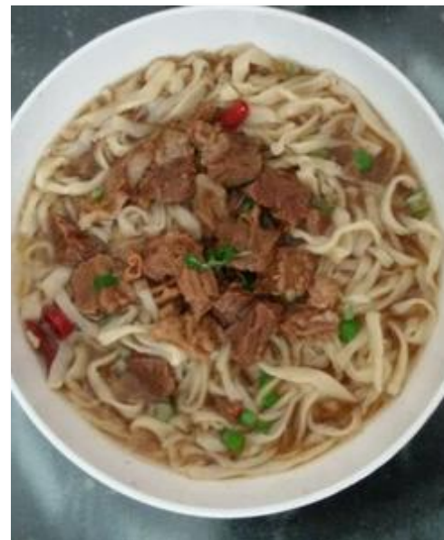
Sopa China de Fideos