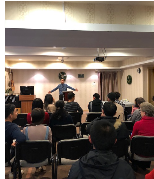
Iglesia Secreta en Dalian

— Hudson Taylor, Fundador de Misión interior de China.