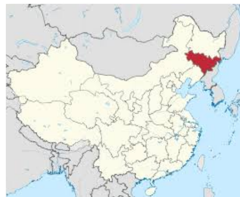
Provincia de Jilin